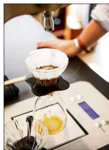
Aushängeschild des Café Frühling: der Überboiler, der die Wassertemperatur aufs Grad genau aufheizt.